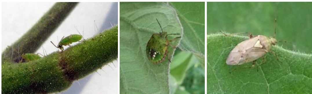
Nesidiocoris tenuis sur tomate – Nezara et Lygus sur aubergine

Sur de nouvelles plantations de concombres AB, dans 1 exploitation du Lot-et-Garonne, les punaises Nezara sont responsables de multiples piqûres sur têtes de plantes.