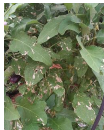
Mines de Tuta absoluta sur aubergine

Pour ce qui est des mesures prophylactiques, merci de vous reporter à la partie Tomate page 3.