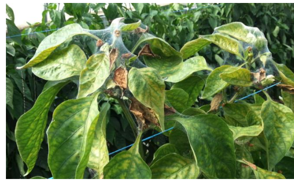
Acariens et toiles sur poivron

En poivron , certaines parcelles présentent de fortes intensités avec des plantes bloquées par les acariens et les toiles (cf. photo).