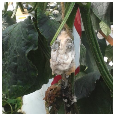
Symptômes bactériens sur concombre

Quelques symptômes de mildiou sur feuilles ont été signalés en production sous serres. Des symptômes de type bactérien ( Erwinia ?) sont observés sur tiges sur des plaies d'effeuillage.