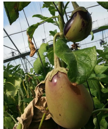
Acariose bronzée sur aubergine

Quelques attaques de doryphore ont également été signalées.