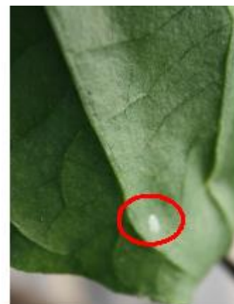
Ponte de pyrale sur feuille de poivron - N DASTE FREDON AQ

ATTENTION ! Surveillez vos parcelles de poivrons proches de maïs.