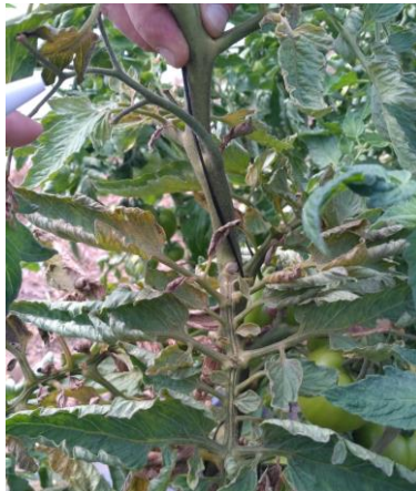
Acariose bronzée sur tomate

En culture hors-sol, des foyers d' acariose bronzée sont toujours signalés dans quelques productions, nécessitant la mise en place d'une gestion.