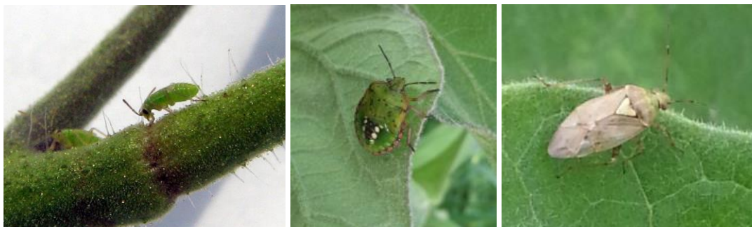
Nesidiocoris tenuis sur tomate – Nezara et Lygus sur aubergine

Les punaises Lygus sont observées dans des parcelles d' aubergines , nécessitant la mise en place de gestion sur les foyers. Des piqûres sur fruits sont signalées sur une parcelles de concombres AB.