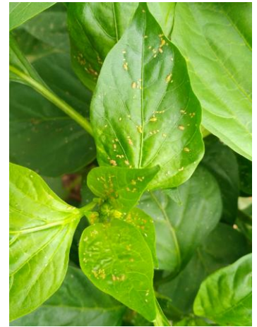
Pucerons sur poivrons

En aubergines et poivrons , de nombreuses coccinelles (adultes et larves) sont visibles sur les foyers de pucerons.