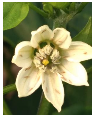
Thrips sur poivrons

En aubergine , on relève la présence de ce bio-agresseur sur la quasi-totalité des parcelles prospectées. Dans certaines parcelles on signale des débuts d'attaques sur feuilles. Certaines variétés semblent plus sensibles que d'autres. En concombre , quelques foyers sont toujours signalés dans une serre. Les thrips sont également présents sur fleurs dans des parcelles de poivrons .