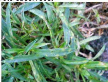
Myzus persicae rosé sur oeillet