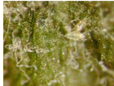
Mâle orangé portant une femelle en phase de mue