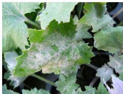
Oidium sur cinéraire