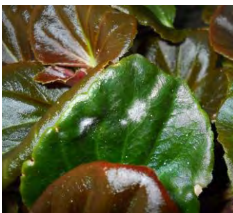
Oidium sur bégonia type Gustave