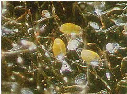
Formes mobiles et œufs ornementés