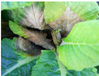
Botrytis sur primevère