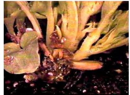
Myrothecium sur pensées