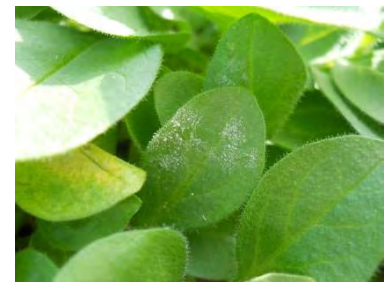
Oidium sur pétunia