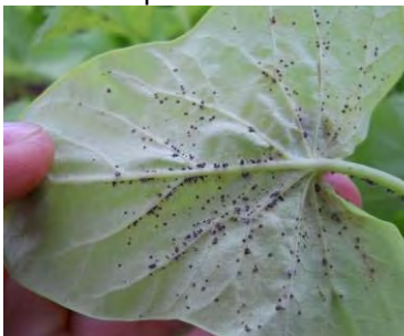
Intumescences sur ipomées