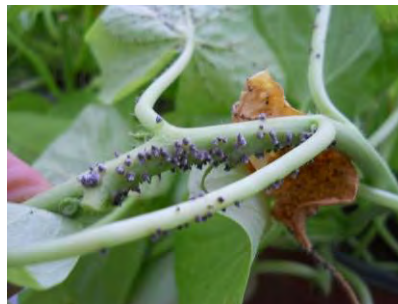
Intumescences sur ipomées