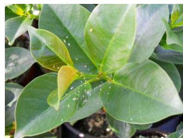
Dégâts et exuvies de Myzus persicae sur Sundaville