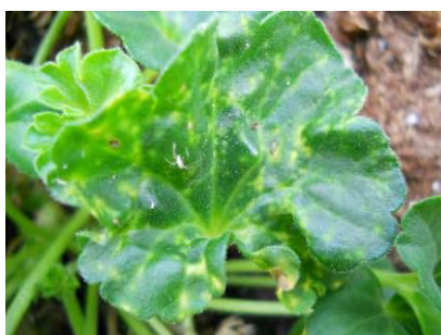
Dégâts et exuvies de Aulacorthum solani sur géranium lierre