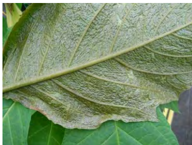
Dégâts de Polyphagotarsonemus latus bronzure face inférieure sur datura, Source : GIE FPSO