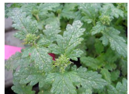
Dégâts de thrips sur verveines