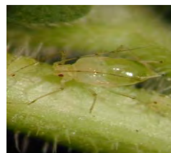
Aulacorthum solani vert clair taches foncées base des cornicules