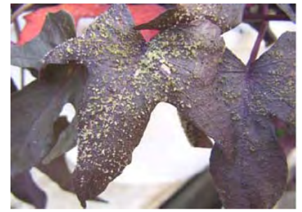
Intumescences sur ipomées