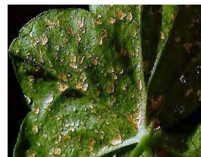
oedème sur géranium lierre