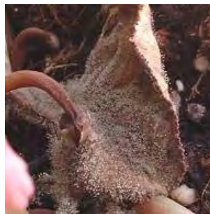
Botrytis sur cyclamen Source : http://www.plantesdusud.com