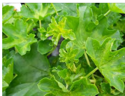
Dégâts de thrips sur géranium lierre