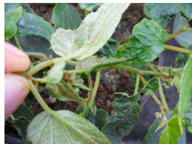
Dégâts de Polyphagotarsonemus latus déformation, blocages sur bégonia