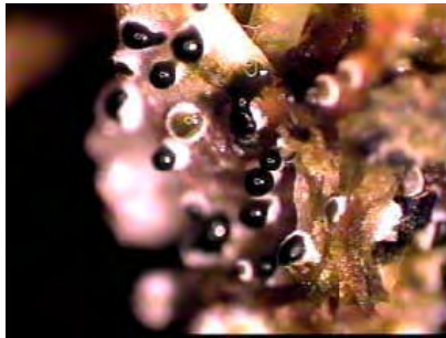
Myrothecium sur pensées