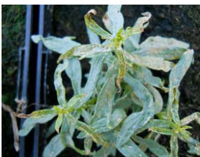
Dégâts de thrips sur estragon