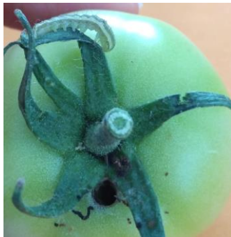
Chenille et dégâts d' Helicoverpa armigera sur tomate

De rares dégâts d' Helicoverpa armigera (sur 5 fruits) sont encore observés sur une parcelle AB du Lot-et-Garonne.