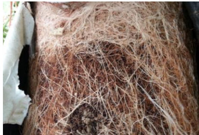
Agrobacterium radiobacter sur racines

Comme en 2016, on signale un cas d' Agrobacterium radiobacter sous forme de foyer, en culture hors-sol sur fibre de coco.