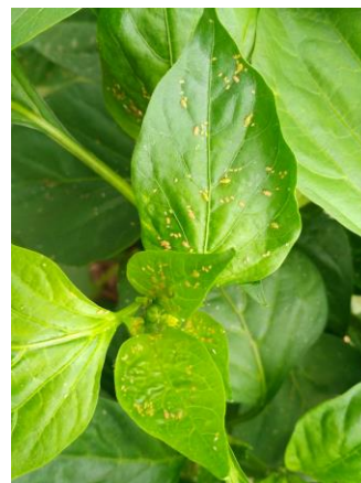
Pucerons sur poivrons

La présence de pucerons est relevée en Dordogne, sur une parcelle de tomates , mais sans conséquence.