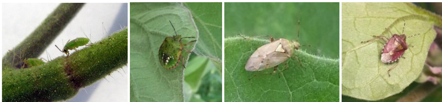
Nesidiocoris tenuis sur tomate – Nezara, Lygus et Dolycoris baccarum sur aubergine

À noter sur une parcelle d' aubergine « bio », la présence de pentatomes des baies ( Dolycoris baccarum ).