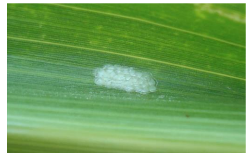
Ponte de pyrale