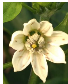
Thrips sur poivrons (Crédit photo : C.MALPEYRE – FREDON Aquitaine)

Le seuil indicatif de risque est fréquemment dépassé dans les productions.