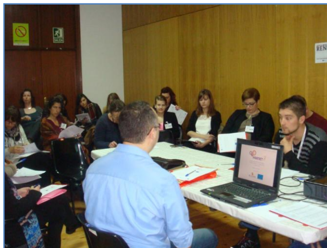
Divulgation du projet PARNET-TIC 2 à la première réunion transnationale à Camariñas, A Coruña

Cette réunion a permis de diffuser le projet PARNET-TIC 2 à la fois pour les autorités locales comme autonome rural dans ces pays. Ils pourraient ainsi apprendre plus sur le projet dans les différents groupes de travail auxquels l'équipe technique PARNET-TIC 2 a participé